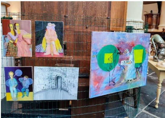
Dit werd als rommel gezien.