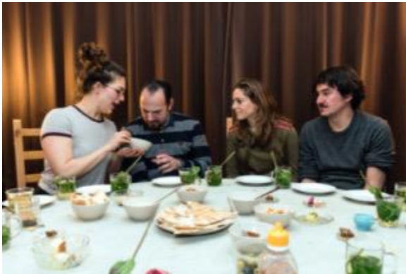
Het diner voor gelukzoekers.