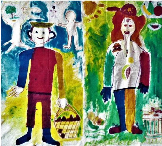
Zeven werken van barmhartigheid.