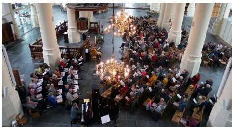
Ik wil kunstenaar zijn in een organisatie.