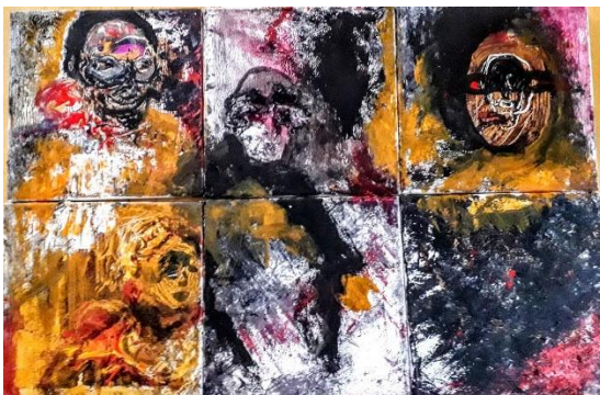
Doekjes van 20 bij 20 doen het goed.