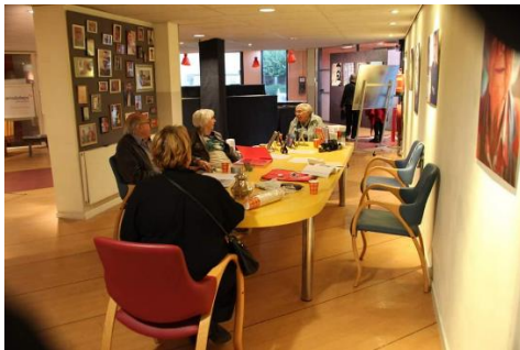
Ik kom binnen: er gebeurt van alles.