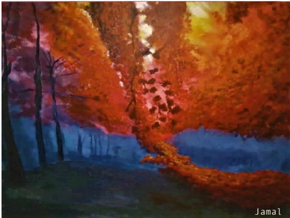
Werk van Jamal in de Robijnhof.