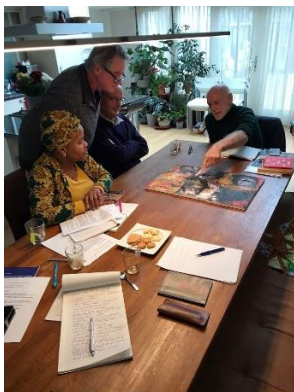
De schilderijtjes doen hun werk, het kunnen er 160 worden.